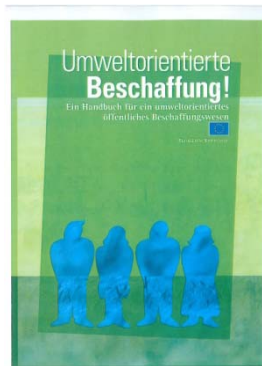
Europäische Kommission 2005